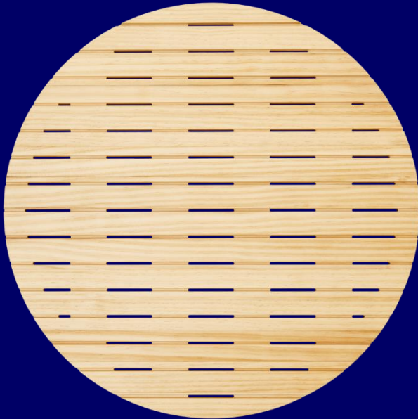
(Vieser Dot Accoya oljad)