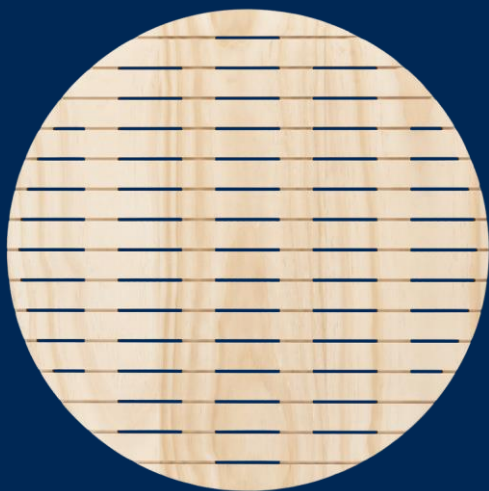
(Vieser Dot Accoya öljytty)